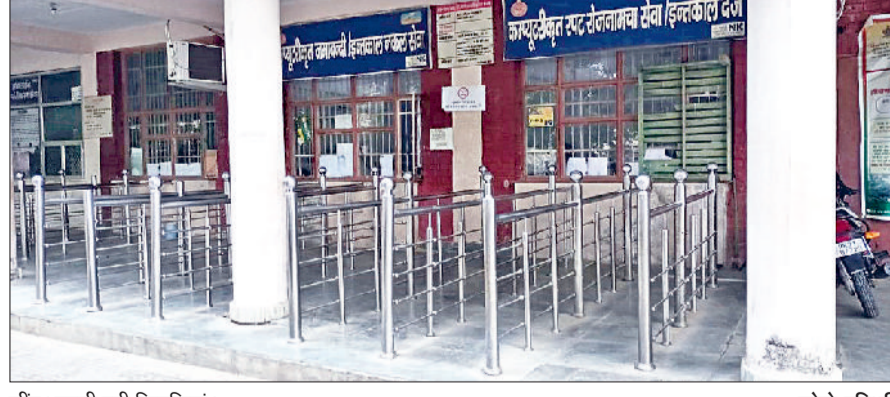
जींद। खाली पड़ी खिड़कियां।

हरिभूमि न्यूज़ ▶▶ जींद पिछले कई दिनों से जिला राजस्व विभाग की वेबसाइट आमजन के लिए परेशानी का सबब बनी हुई है। सोमवार को भी साइट ठप रही। जिसके कारण तहसील कार्यालय के कार्य पूरे नहीं हो पाए। वेबसाइट ठप रहने से नकलबंदी, जमाबंदी, ई-गिरदावरी, फर्द, इंतकाल का कार्य प्रभावित हुआ। कार्य प्रभावित होने