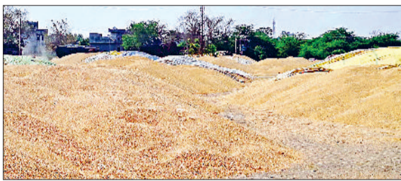
जींद। खुले में रखा गेहूं।

परिवर्तनशील मौसम किसानों के लिए परेशानी बना हुआ है। बीती रात जिले में कहीं हलकी बूंदबांदी तो जुलाना में 6.4 एमएम नरवाना में चार एमएम बारिश हुई। जिसके चलते तापमान में गिरावट दर्ज की गई। सोमवार को दोपहर तक मौसम साफ बना रहा। बाद में मौसम करवट लेता रहा। बादलों सूरज के बीच लुकाछिपी चलती रही। रात बारिश से जुलाना व नरवाना इलाके में गेहूं कटाई तथा कढ़ाई के कार्य पर प्रभाव देखने को मिला। सोमवार को अधिकतम तापमान 36 डिग्री तथा न्यूनतम तापमान 21 डिग्री दर्ज किया। मौसम में आदत 18 प्रतिशत जबकि हवा की गति 14 किलोमीटर प्रति घंटा दर्ज की गई। मौसम विभाग के अनुसार मौसम के परिवर्तनशील होने के कारण