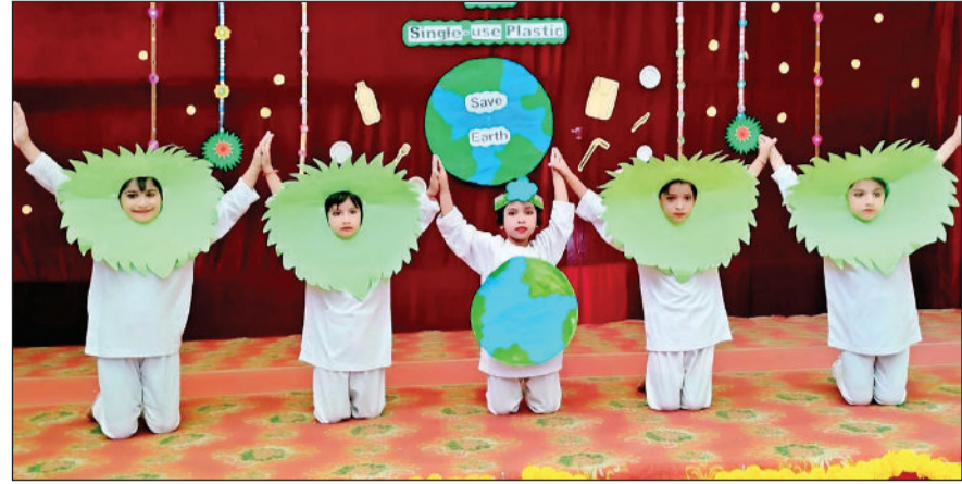
जीद। कार्यक्रम में भाग लेते बच्चे।