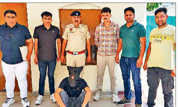
कैथल। स्पेशल डिटेक्टिव यूनिट पुलिस गिरफ्त में आरोपित।

नरवाना: गेहूं का उठान धीमा होने से किसान परेशान नरवाना। पिछले कई दिनों से बदलते मौसम के मिजाज ने किसान और मंडियों में आदतियों को टेशन बढ़ाई हुई थी। वहीं रविवार-सोमवार की रात को हलके में हुई बारिश से मंडियों में आदतियों के चेहरे मुरझाए हैं क्योंकि मंडियों में काफी आदतियों की बुकानों के आगे पड़ी गेहूं बारिश से भीग गई और एजेंसीयों में खरीदी गेहूं के करे बैगों के नीचे बारिश को पानी भर गया। गेहूं खरीद के बाद उठान भी खड़ी नहीं हो रहा जिस वजह से मंडियों में गेहूं के बड़े ढेर लग रहे हैं नरवाना क्षेत्र की मंडियों में रविवार तक के गेहूं खरीद वितरण के अनुसार एजेंसीयों में अबतक हैफेड में केवल 29 प्रतिशत, डीएफएससी ने 21 प्रतिशत व वेयर हाउस में अबतक केवल 17 प्रतिशत गेहूं खरीद का उठान किया है। वहीं मंडियों में अबतक उठान के अमान में 639302 टिकटल गेहूं पड़ी हुई है। इस बारे में खरीद एजेंसीयों के अधिकारियों से बात की तो उन्होंने कहा कि गाड़ियां कम उपलब्ध होने की वजह से उठान में देरी हो रही है। वहीं नरवाना की कपास मंडी में गेहूं से भर बैग बारिश के पानी से निकालते हुए दिखाई दिये वहीं मौके पर जिनकी गेहूं बारिश में भीग गई उनका कहना है कि मंडी में सींसेज की समस्या गंभीर रूप से बनी हुई है जिससे पानी का विकास नहीं हो रहा। उन्होंने कहा कि यदि हलकी सी भी बारिश होती है तो मंडी में पड़ी गेहूं पानी की वजह से खराब हो जाती है। लेकिन गेहूं की कटाई के बाद मंडियों में गेहूं के बड़े-बड़े ढेर लग चुके हैं।