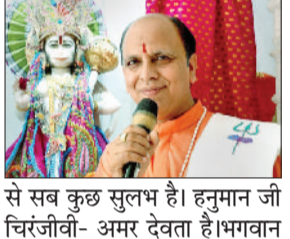
से सब कुछ सुलभ है। हनुमान जी चिरंजीवी- अमर देवता है। भगवान श्रीराम का जहां जहां पावन नाम संकीर्तन होता है वहां श्री हनुमान जी अवश्य विद्यमान रहते हैं 'भक्ति के इतिहास में प्रभु श्री राम की जैसी भक्ति श्री हनुमान जी ने की है, वैसे किसी ने नहीं की है। इसलिए हनुमान जी भक्ति शिरोमणि है। आज संपूर्ण विश्व में हनुमान जी की सर्वाधिक पूजा-अर्चना की जाती है 'जिस प्रकार राम का अवतार लोक शिक्षा एवं राक्षसों के विनाश के लिए हुआ था। उसी प्रकार हनुमान जी का अवतार राम की लीला में सहायता के लिए तथा सेवा भाव की शिक्षा के लिए हुआ था' आधुनिक समाज में भोग वादी प्रवृत्तियां ज्यादा प्रबल हो गई हैं, चित्र निर्माण और सांत्विक दृष्टिकोण हास की ओर अग्रसर है। इस विषम परिस्थिति में हनुमान जी की पूजा और उनके आचरण के अनुकरण का विशेष महत्व है। हनुमान सर्वगुण संपन्न है। उनमें अनन्य भगवत भक्ति, अखंड ब्रह्मचर्य, विवेक, विद्वान बुद्धिमत्ता, चतुरता, बल, पौरुष साहस और सदाचार है 'वे श्रीराम के परम भक्त