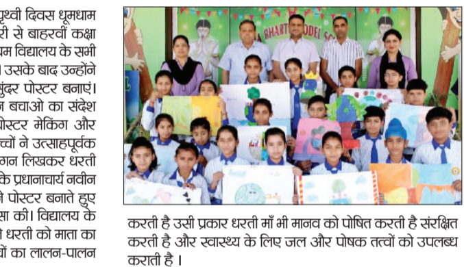
करती है उसी प्रकार धरती माँ भी मानव को पोषित करती है संरक्षित करती है और स्वास्थ्य के लिए जल और पोषक तत्वों को उपलब्ध करती है।