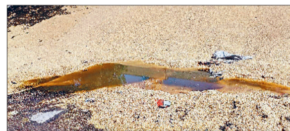
नरवाना। नरवाना कपास मंडी में बारिश के पानी में पड़ी गेहूं।

दोपहर तक मौसम रहा साफ, बाद में बादलों ने रोकी सूरज की किरणों की राह