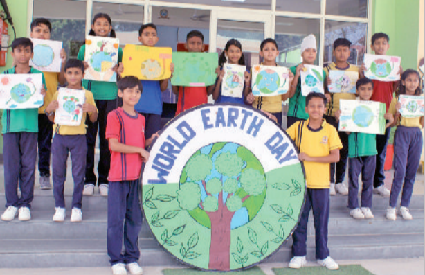
कैथल। पृथ्वी दिवस पर बनाए पोस्टरों को दिखाते दर्शन अकादमी कैथल के विद्यार्थी।