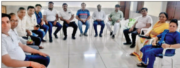
जीद। कार्यकारिणी की बैठक होते हुए।