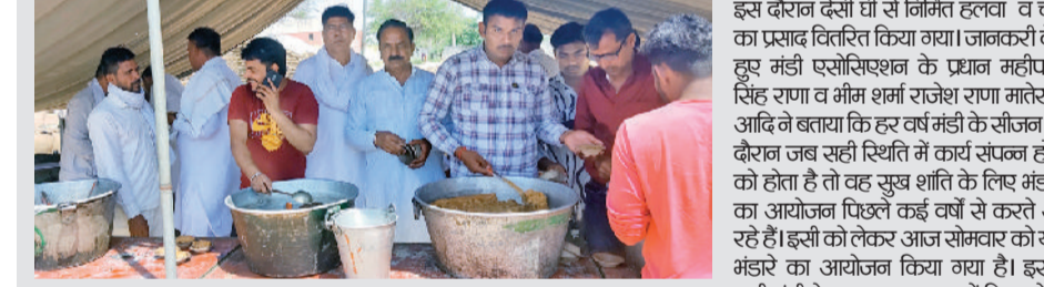
राजौद। अनाज मंडी में भंडारे के दौरान प्रसाद वितरित करते मंडी एसोसिएशन के सदस्य।