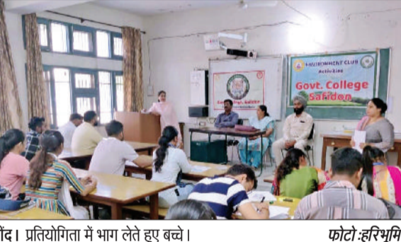
जीद। प्रतियोगिता में भाग लेते हुए बच्चे।