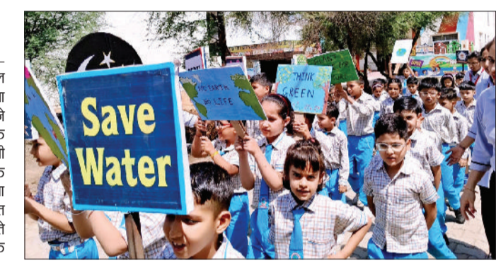
जीद। पृथ्वी दिवस पर रैली निकाल कर शहरवासियों को जागरूक करते बच्चे।

उचाना। चाणक्य इंटरनेशनल स्कूल क्यूहन में विश्व पृथ्वी दिवस मनाया गया। नर्सरी से यूकेजी तक रंग भरने की गतिविधि पहली से तीसरी तक पौधारोपण चौथी से आठवीं तक पृथ्वी दिवस पर चार्ट एव व्रॉ से 12वीं तक के विद्यार्थियों की भाषण प्रतियोगिता कराई गई। विद्यालय में पौधे रोपित